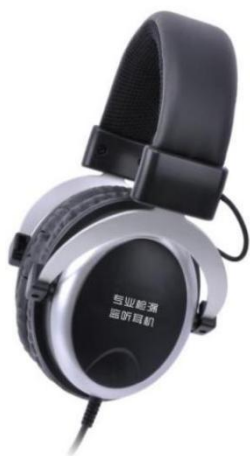
全封闭式专业检漏监听耳机